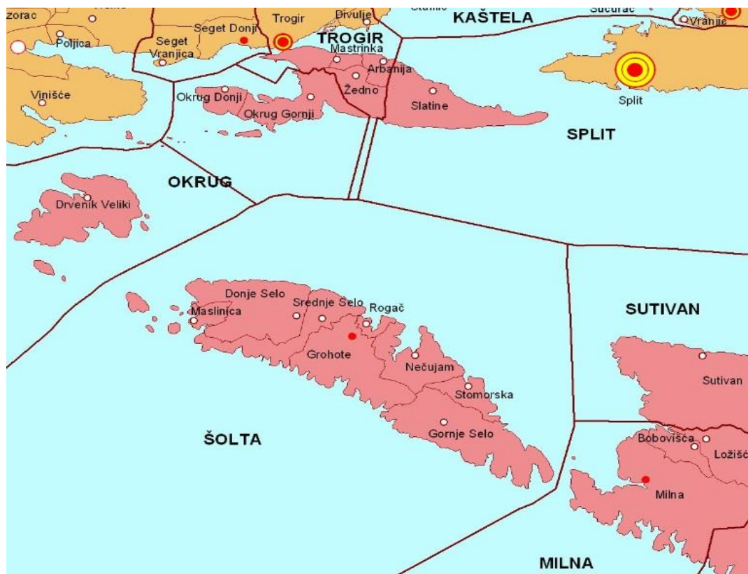
Slika 2.1.-1: Geografski položaj Općine Šolta

Sjedište Općine je u naselju Grohote koje predstavlja malo razvojno središte kojem gravitira čitava Općina. Broj stanovnika u Općini Šolta prema popisu iz 2011. godine je 1700.