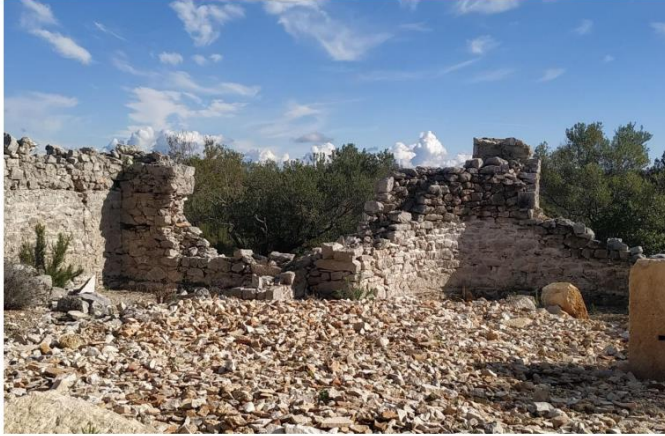
Slika 2. Unutrašnjost crkve nakon čišćenja kamene gomile