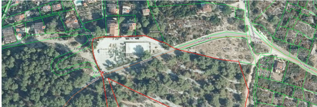
slika 1. Ortofoto prikaz predmetnog igrališta na k.č. 223/1

Predmet projekta je rekonstrukcija nogometnog igrališta na dijelu k.č. 223/1 k.o. Donje Selo na otoku Šolta.