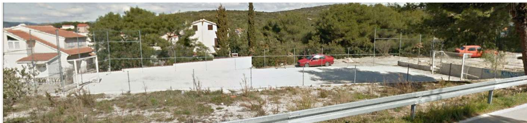
slika 2. Postojeće stanje igrališta

Projekt podrazumijeva uklanjanje postojeće i ugradnja nove ograde te ugradnja multifunkcionalne podloge.