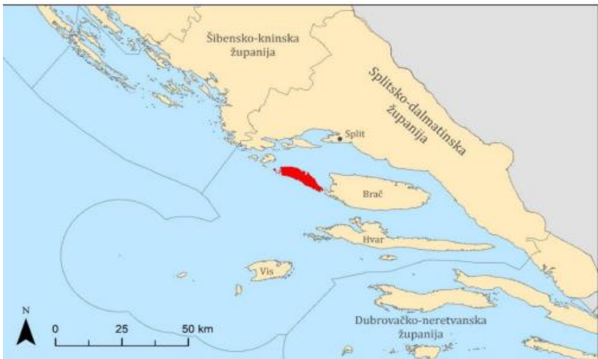
Slika 1. Položaj Općine Šolta u prostoru SD Županije

(7-15 km). Na zapadnoj strani otoka, ispred naselja Maslinica, nalazi se 7 otočića: Kamičić, Radula, Grmej, Polebrnjak, Saskinja, Balkun i Stipanska. Zajedno s cijelom južnom obalom Šolte otoci spadaju u područje nacionalne ekološke mreže, odnosno u područje koje se smatra važnim za očuvanje biljnih i životinjskih vrsta.